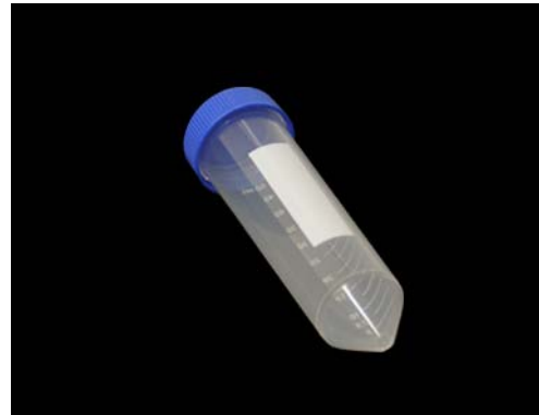
Ref. / Code: 40410500