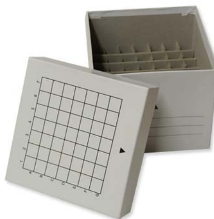
Ref. / Code: 40340490